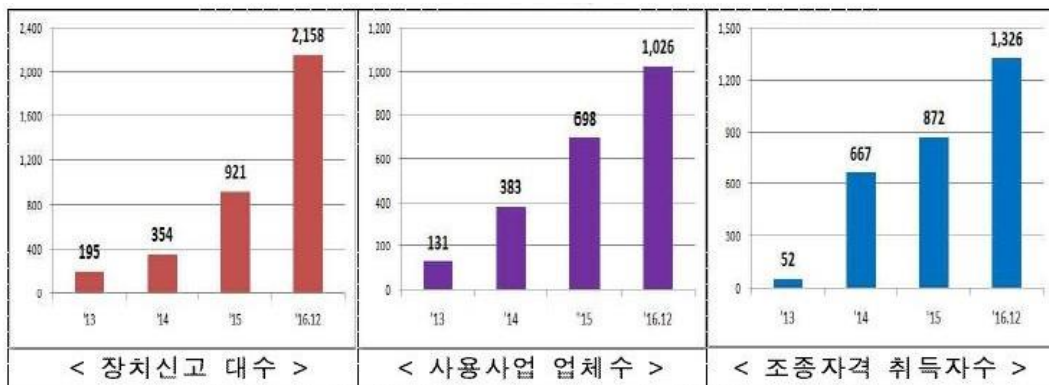
그림 2. 국내 드론 운영 현황

정부의 드론산업 규제 완화에 힘입어 국토부는 2016 년 12 월 20 일 기준으로 국내 영리목적 드론 사용사업체의 수가 1000 개 이상, 신고 등록된 드론도 2000 여대를 넘기며 지속적인 성장세를 보이고 있다고 밝혔다. 2013 년부터 2016 년 말까지 매년 통계조사를 보면 드론의 수는 실제 대폭 증가하였다.